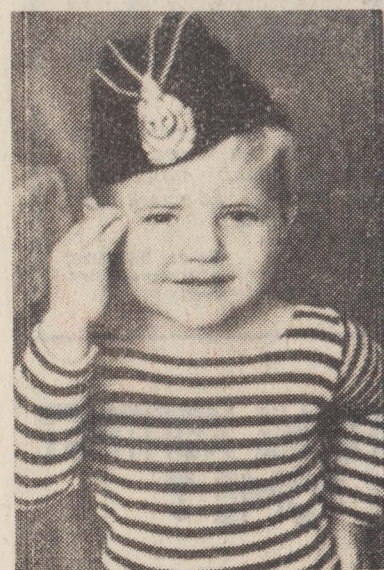
— ЕСТЬ ВСТАТЬ В СТРОИ!